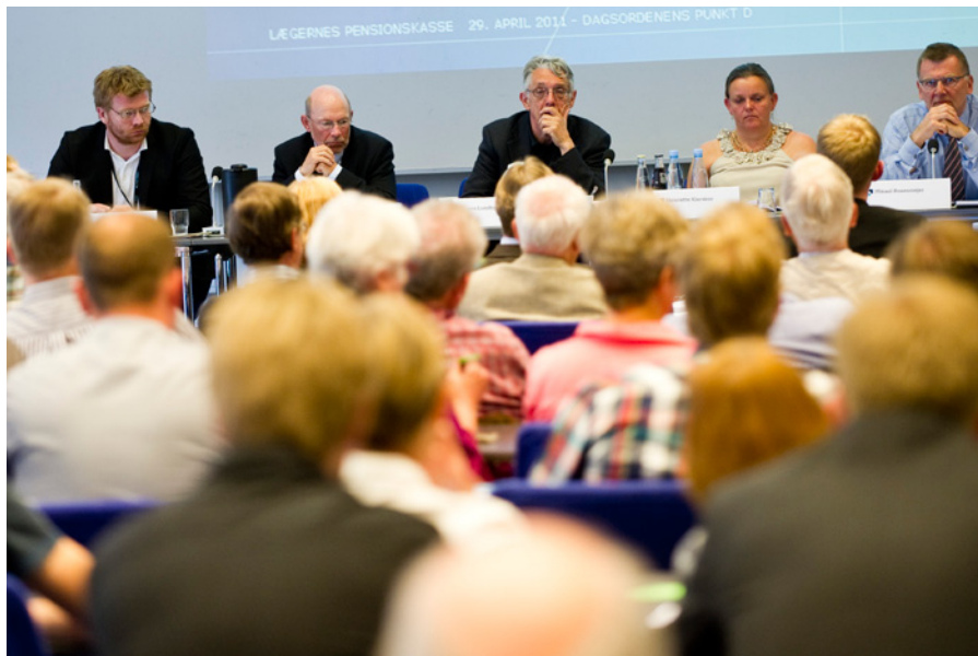
Bestyrelse, delegerede og medlemmer samlet til generalforsamling i 2011.